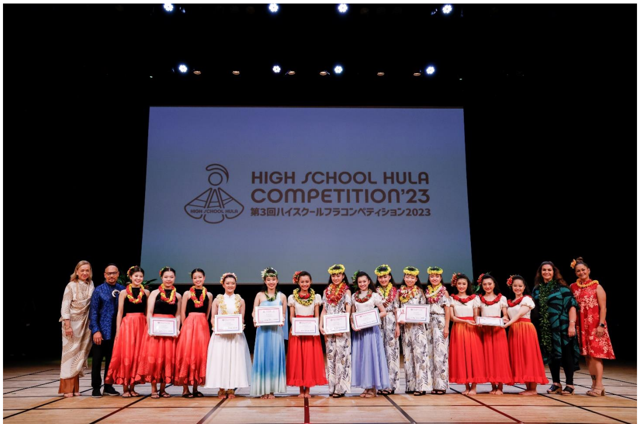
第3回ハイスクールフラコンペティション 2023