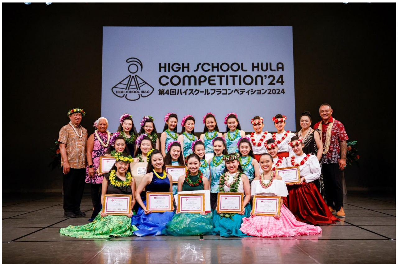
第4回ハイスクールフラコンペティション 2024